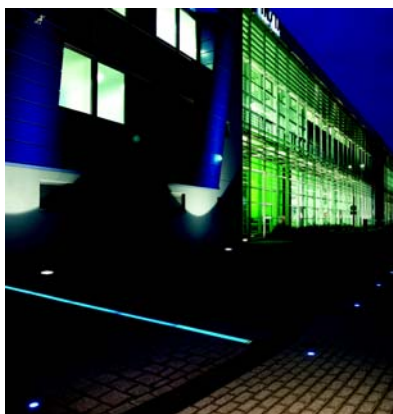
Combinación de sistemas en un mismo proyecto