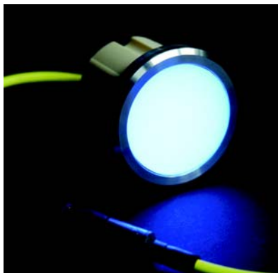
Detalle Light Point

Más información, 902 170 312. www.aco.es aco@aco.es