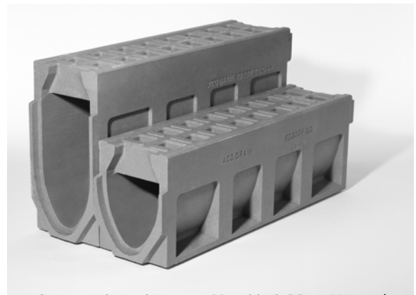
Con una altura de 53 cm, Monoblock RD200V 20.0 (a la izquierda) cuenta con una capacidad hidráulica testada de 66 l/s.

El Grupo ACO, fundado en Rendsburg (Alemania) en 1946, es el líder mundial en sistemas de drenaje. Está presente en 28 países en todo el mundo. La empresa ofrece una amplia gama de canales de drenaje, sumideros, tapas de registro, separadores de hidrocarburos y grasas, canalización en acero inoxidable y estaciones de bombeo, entre otros. ACO Productos Polímeros S.A., ubicada en Girona, es la filial en España y cuenta con una línea de producción propia.