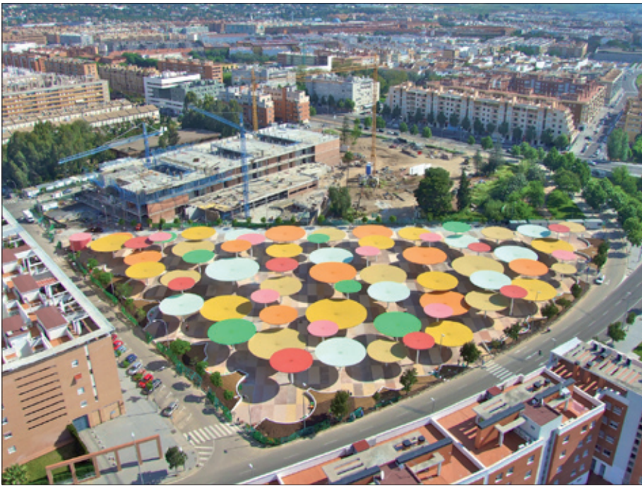
Vista aérea del parque urbano de Córdoba