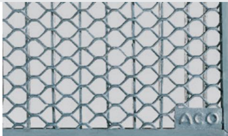
Reja entramada en acero galvanizado para soporte de carga 1,5KN peatonal. Art.nº.: 00035573