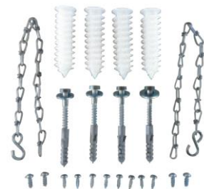
Set de montaje estándar de fijación de tragaluz con reja para soporte de carga 1,5KN peatonal. Art.nº.: 00035598