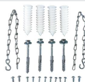
Set de montaje estándar de fijación de tragaluz con reja para soporte de carga 1,5KN peatonal. Art.nº.: 00035598