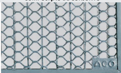
Grelha entramada em aço galvanizado para aplicações da cargas 1,5KN pedonal. Art.nº.: 00035573