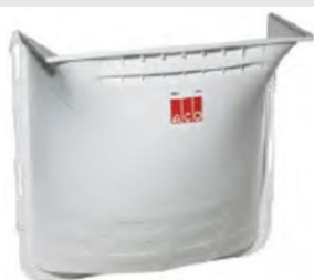
Estrutura clarabóia sem grelha. Art.nº.: 0003566