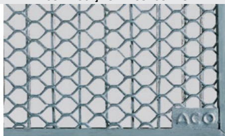
Grelha entramada em aço galvanizado para aplicações da cargas 1,5KN pedonal. Art.nº.: 00038767