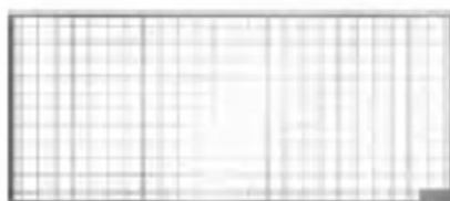
Grelha entramada em aço galvanizado para aplicações da cargas 1,5KN pedonal. Art.nº.: 00038768