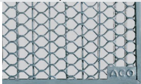
Grelha entramada em aço galvanizado para aplicações da cargas 1,5KN pedonal. Art.nº.: 00038770