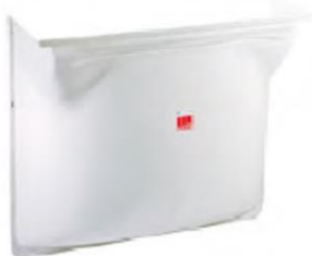
Estrutura clarabóia sem grelha. Art.nº.: 00038766