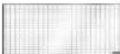
Grelha entramada em aço galvanizado para aplicações da cargas 1,5KN pedonal. Art.nº.: 00315999