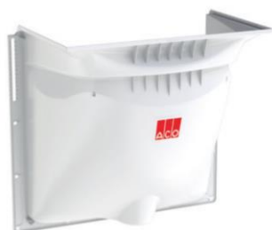
Estrutura clarabóia sem grelha. Art.nº.: 00375001