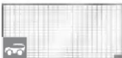
Grelha entramada em aço galvanizado para aplicações da cargas 9,0KN veiculos. Art.nº.: 00375029