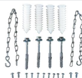
Set de montaje estándar de fijación de tragaluz con reja para soporte de carga 1,5KN peatonal. Art.nº.: 00375036