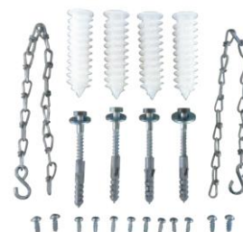
Set de montaje estándar de fijación de tragaluz con reja para soporte de carga 9,0KN vehiculos ligeros. Art.nº.: 00375036