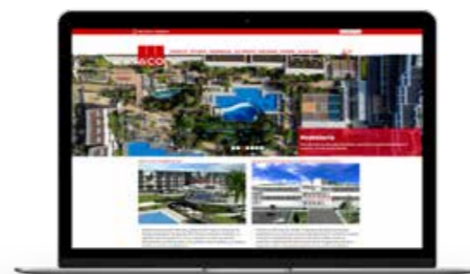
Inversión continua en branding y posicionamiento WEB Investimento contínuo em branding e posicionamento WEB