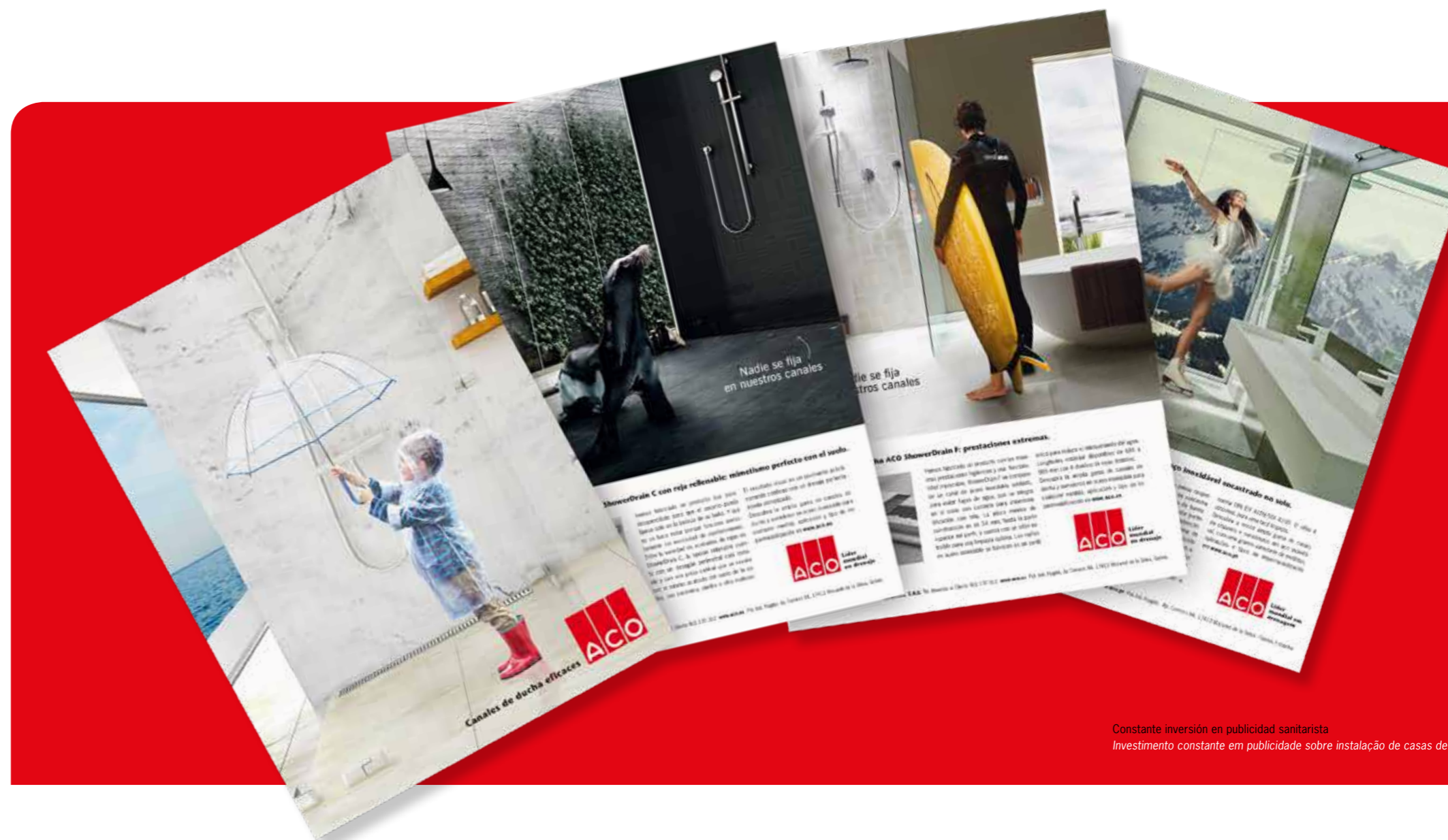
Constante inversión en publicidad sanitaria Investimento constante em publicidade sobre instalação de casas de banho

Na ACO investimos em comunicação de marca em colaboração com o distribuidor. Publicidade na imprensa especializada, documentação comercial à medida para cada armazém, expositores adequados para os espaços das lojas onde são exibidos... Além disso, dispomos de um site Web com um catálogo completo no qual pode encontrar todas as soluções da ACO e inclusivamente fazer pré-encomendas online.