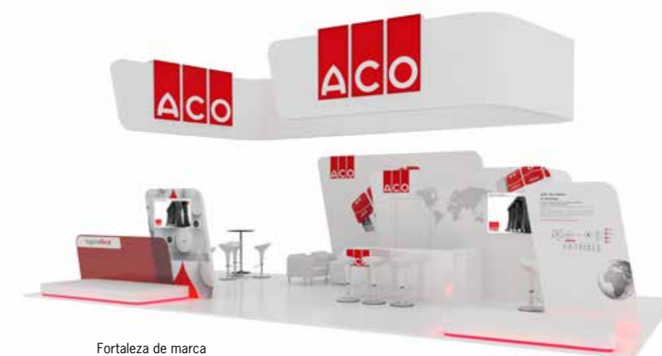
Fortaleza de marca Força da marca