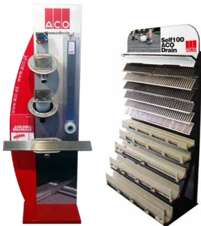
Soporte en punto de venta Apoio no ponto de venda