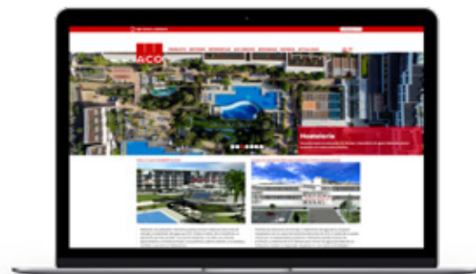
Inversión continua en branding y posicionamiento WEB Investimento contínuo em branding e posicionamento WEB