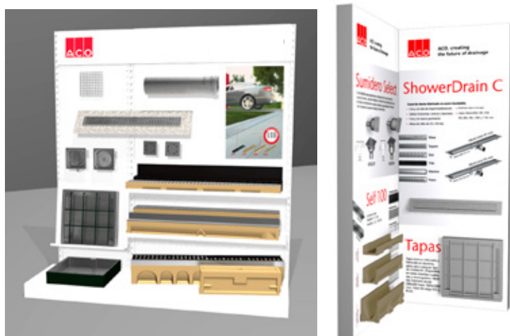
Soporte en punto de venta Apoio no ponto de venda